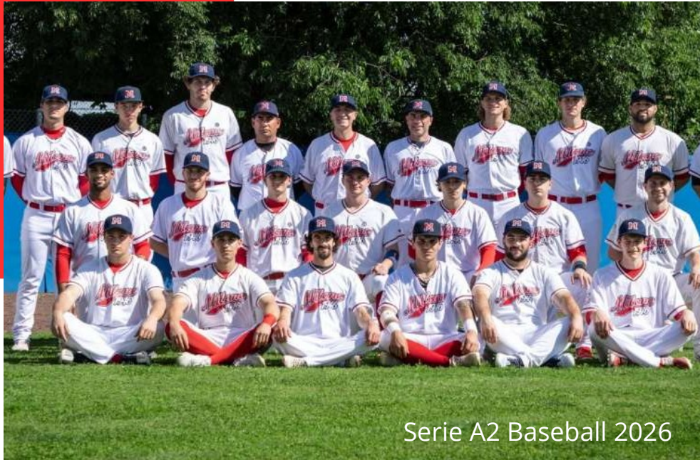
Serie A2 Baseball 2026