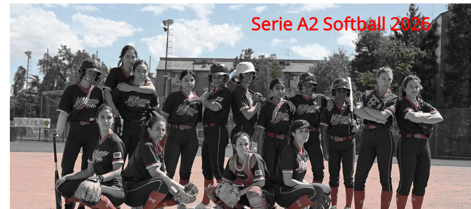
Serie A2 Softball 2026

Incentivazione dei Soci / Tesserati del MBS'46 (circa 300 nuclei familiari) ad appoggiarsi alla Vs Impresa, con menzione dallo Speaker durante gli incontri casalinghi (squadra seniores baseball). Sconto per gli associati